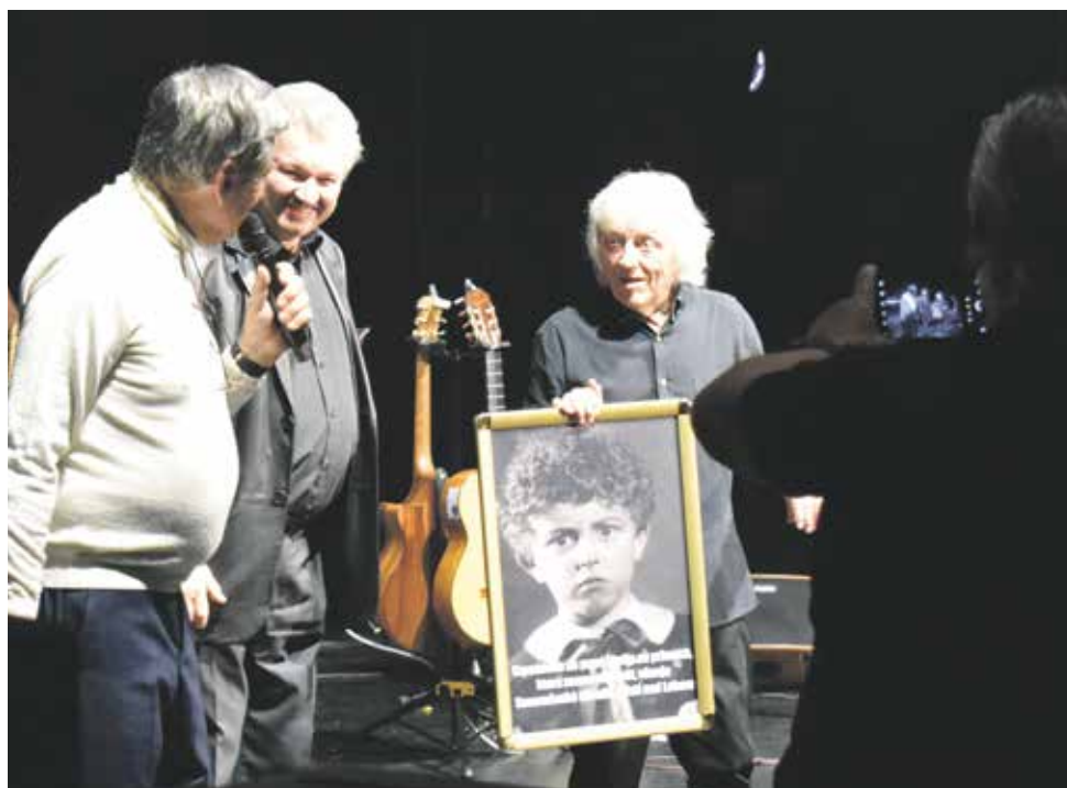
Gratulantí předávají dary

V průběhu koncertu zpěvák několikrát zavzpomínal na své účinkování v divadle i na bydliště v Resselově ulici, kde s bratrem hrávali a pořádali vystoupení pro své kamarády. Ústí bylo jeho domovem až do roku 1969. Na zdejším gymnáziu v Jatečnách i roku 1962 maturoval.