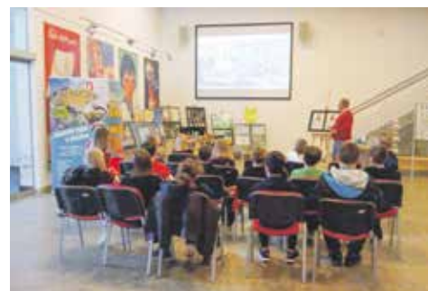
Exkurze žáků v informačním středisku

Exkurze jsou vhodným doplňkem například pro výuku zeměpisu, dějepisu či občanské výchovy a mohou pomoci vytvářet pozitivní vztah žáků a studentů k jejich městu. Domluvit exkurzi lze osobně v informačním středisku, telefonicky na čísle 475 271 700 nebo e-mailem na adresu info.stredisko@mag-ul.cz.