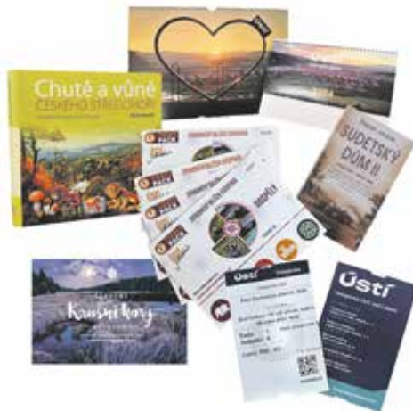
Praktickým dárkem bude také sada kalendářů na rok 2024. Nástěnný i čtrnáctidenní stolní

Chtěli byste darovat spíše zážitek? V infostředisku seženete vstupenky na většinu kulturních akcí konajících se v Severočeském divadle, Činoherním studiu či v Kulturním středisku města Ústí nad Labem.