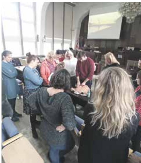
Ukázka samovyšetření na maketách

První přednáška byla realizována s Fakultou zdravotnických studií UJEP a týkala se tématu prevence rakoviny prsu a varlat. Navázala tak na Růžový říjen, který je předcházení tomuto nepříjemnému onemocnění věnován. Součástí byla nejen teoretická část, ale také praktická ukázka samovyšetření na maketách. Všichni účastníci