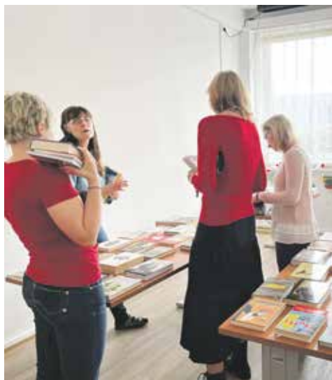
Dejte knihám a oblečení druhou šanci