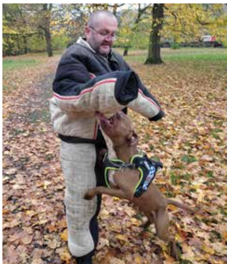
Výcvik služebních psů

Strážníci se svými čtyřnohými parťáky procvičovali poslušnost psa, zjištění pachové sto-