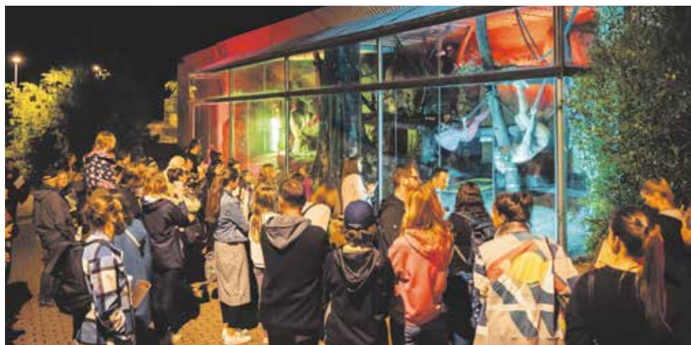
#kulturunezastavis, Cirk La Putyka, autor: Radim Míech

Všechna představení byla pečlivě připravována a konzultována s odborným týmem zoologů. Všem návštěvníkům děkujeme za účast.