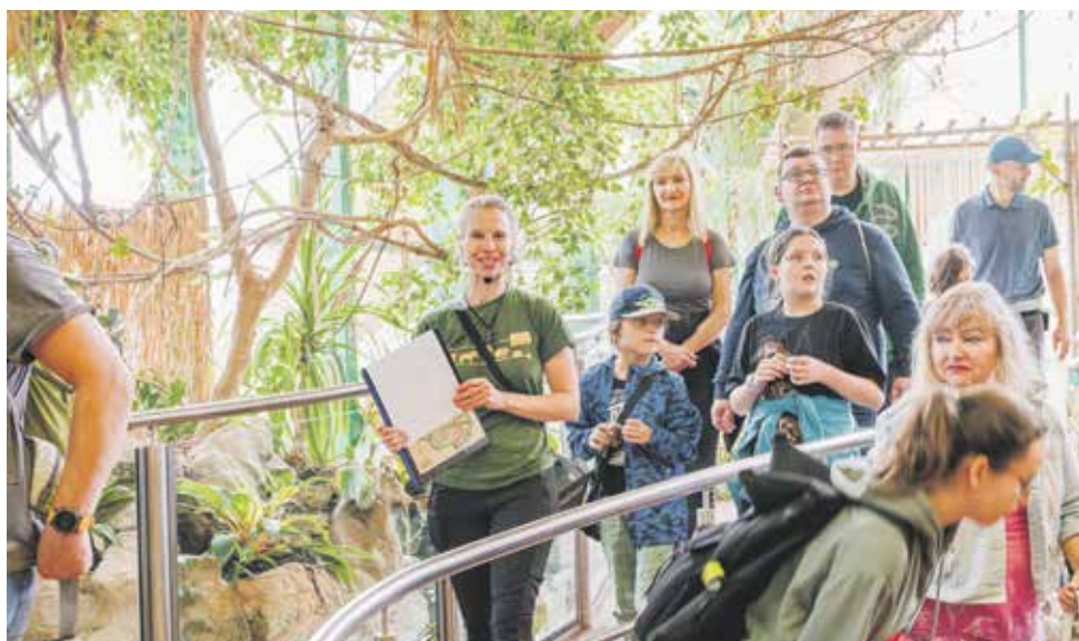
Den přátel zoo

Setkání patronů a adoptivních rodičů, které proběhlo 7. října, se neslo v přátelském duchu. Představili jsme nový koncept patronací, pokřtili stolní kalendář pro rok 2024 a v rámci komentovaných prohlídek seznámili naše pod-