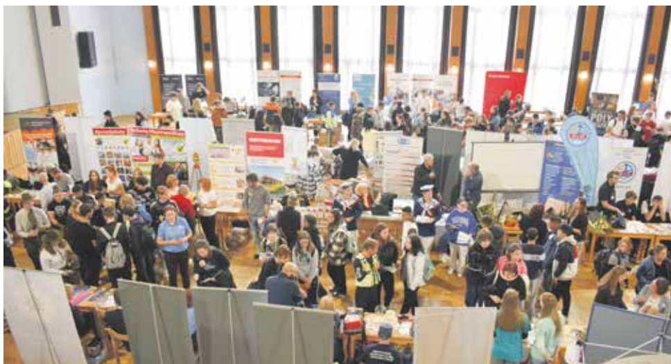
Stánky na veletrhu vzdělávání