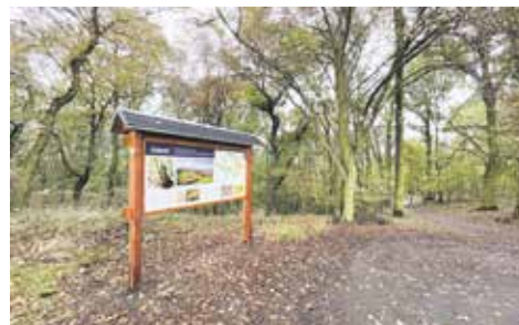
Nová informační cedule na Střížovickém vrchu

Střížovický vrch je protáhlý zalesněný kopec v trojúhelníku mezi ústeckými čtvrtěmi Předlice, Klíše a Všebořice. Na náhorní plošině je několik vyhlídkových míst, ze kterých je možné zhlédnout převážnou část okolí města, České středohoří i panorama Krušných hor. Nachází se zde tři vycházkové okruhy, červený, žlutý a modrý, z nichž každý má různou délku a náročnost.