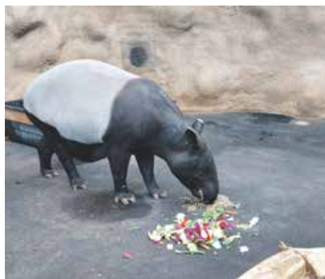
Samice tapíra čabrakového, autor: Markéta Gloneková

Zoologická zahrada uspořádala veřejnou sbírku Seznamka pro tapíry. Do sbírky, která probíhala od září do konce října, se zapojilo 125 lidí a celkem vybrali 123 050 Kč. Finanční prostředky využije zoo na úpravu areálu pro tapíry. Tapíři obývají bývalý pavilon slonů, který však nemá vhodný koridor propojující vnitřní a venkovní prostory. Díky podpoře veřejnosti vznikne nový koridor z vnitřní stáje. Bude obsahovat bezpečnostní bariéry, přístupovou rampu a nové osvětlení. Každý z dárců, který přispěl alespoň 1 000 korun, se automaticky stává patronem zoo. Tapír čabrakový je jediným druhem asijského tapíra, který žije v pralesích jihovýchodní Asie na území Sumatry, Thajska a Malajsie.