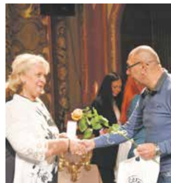
Předávání Zlatého kříže za darování krve

Tradiční slavnostní akce k ocenění bezpříspěvkových dárců krve opět proběhla v Severočeském divadle. Zlaté plakety prof. MUDr. Jana Janského a Zlaté kříže Českého červeného kříže 1.–3. stupně byly předány jako vyjádření díku za bezpříspěvkové darování krve. Ocenění se udělovala za 40, 80, 120 nebo 160 bezpříspěvkových odběrů.