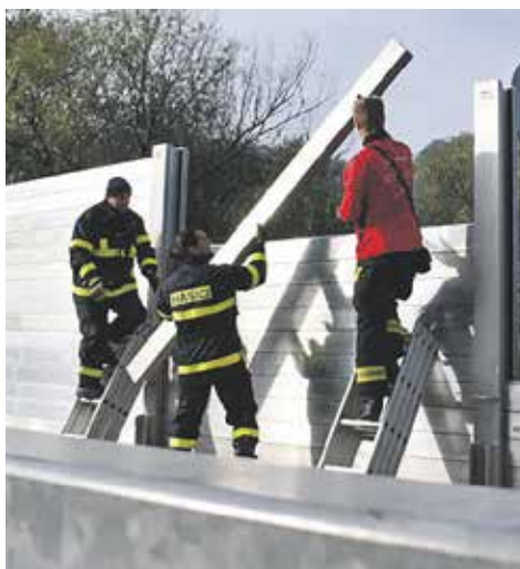
Stavba protipovodňových zábran na Střekově

Milovníci relaxace mají důvod k radosti. Koupaliště Brná rozšířilo své služby o saunový provoz. Sauna je umístěna v blízkosti rekreačního bazénu a nabízí návštěvníkům krásné pohledy na protékající řeku Labe. K dispozici je i doplňkový prodej se sortimentem k saunování, který si můžete zapůjčit či zakoupit, nechybí ani teplé a studené nápoje. Tato sauna je určena pro