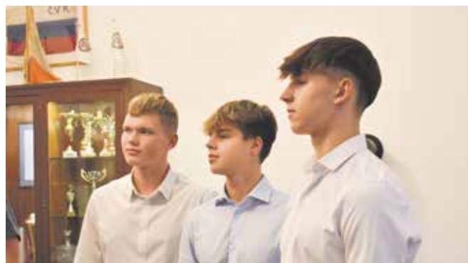
Zástupci Českého veslařského klubu Ústí nad Labem.

Radní poděkoval sportovcům za vzornou reprezentaci města v průběhu celé sezony a oce-