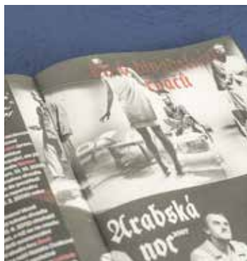
Kniha Činoherní Ústí. Ve znamení kovadliny