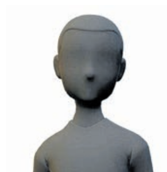
Michal Šidák (ODS)