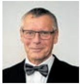
Petr Nedvědický primátor Ústí nad Labem