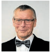
Petr Nedvědický primátor Ústí nad Labem