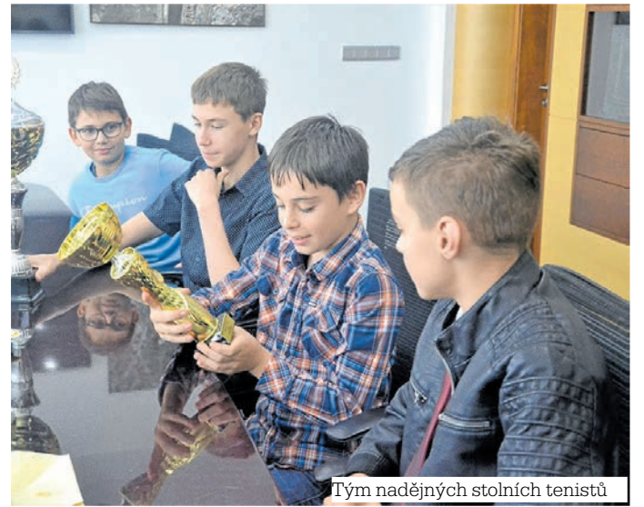
Tým nadějných stolních tenistů

Za vynikající výkony a vzornou reprezentaci města všem sportovcům poděkoval primátor Petr Nedvědícký se svým náměstkem Michalem Ševcovicem. Předali jim též ocenění a dárky.